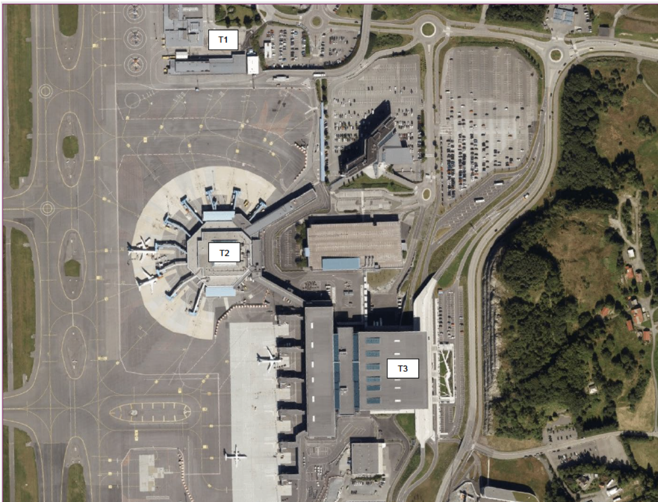
Bilde 1 | Bergen lufthavn | Terminal 1, 2 & 3 (flyfoto)